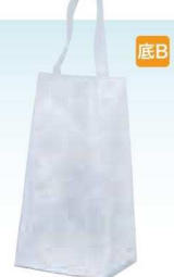
HDシオンブーケバッグ L