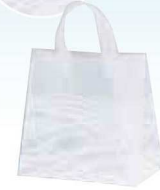
クレールバッグ 26 グラス