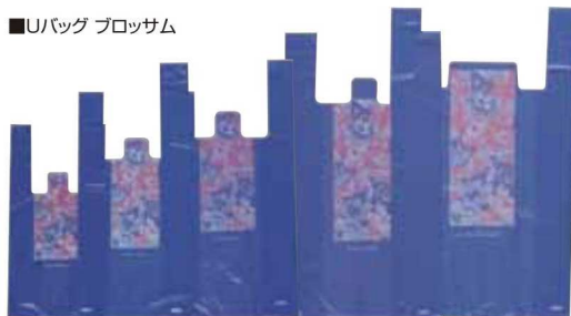
SS S M L LL