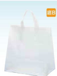
クレールバッグ 30 無地