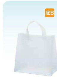
クレールバッグ 26 無地