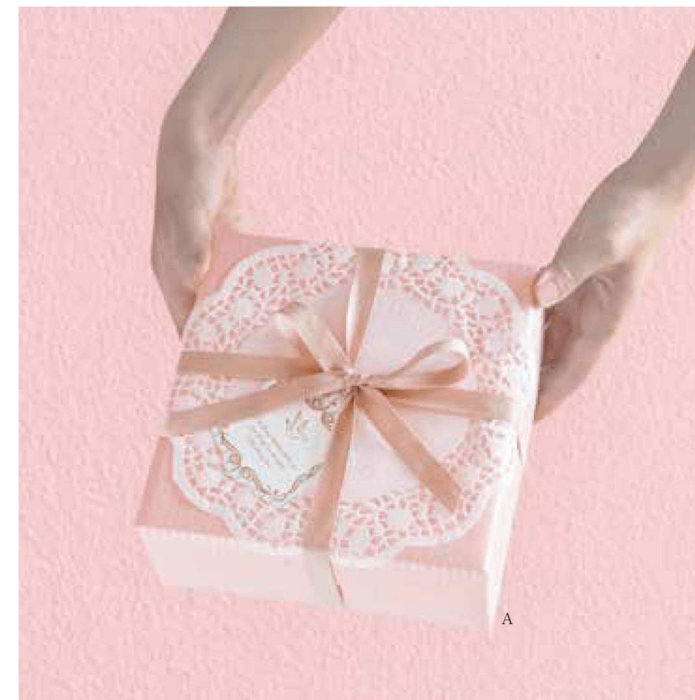
クリスタルな輝きで 女性が喜ぶラッピング