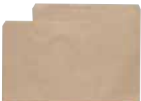
クラフト小 クラフト大