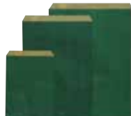
12 18 21