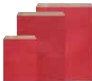
12 18 21