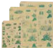
12 18 21