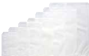
白7 白5 白4 白3 白2 白1 白特1