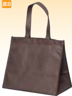
SF バッグブラウン M