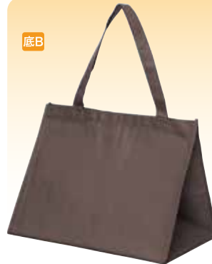
SF バッグブラウン L