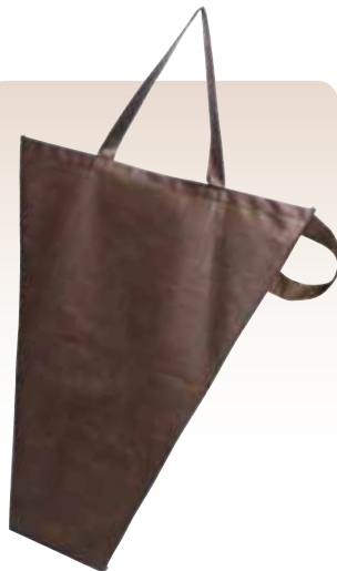
ハンディブーケバッグ L