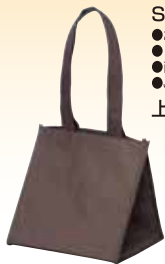
SF バッグブラウン S