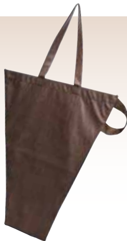
ハンディブーケバッグ M