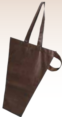
ハンディブーケバッグ S